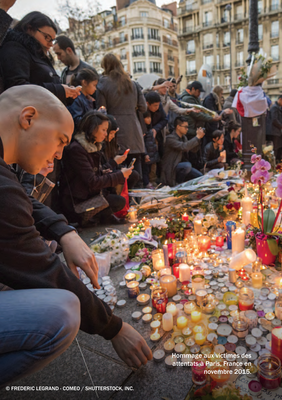
Hommage aux victimes des attentats à Paris, France en novembre 2015.