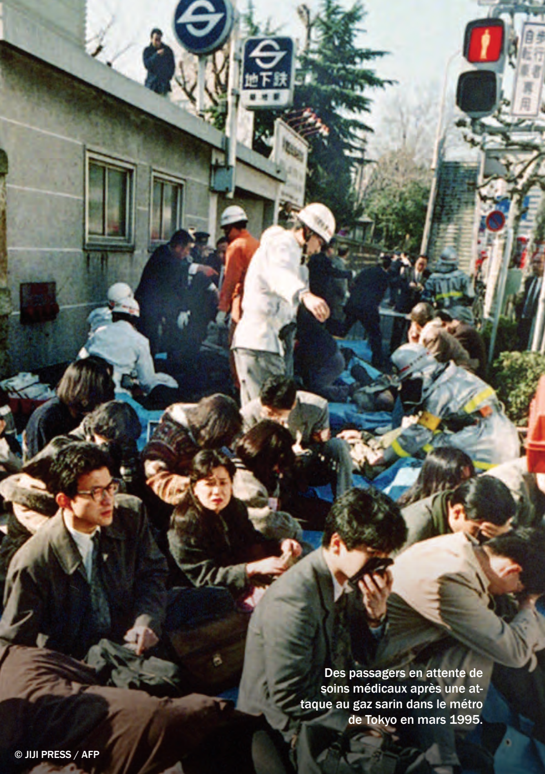
Des passagers en attente de soins médicaux après une attaque au gaz sarin dans le métro de Tokyo en mars 1995.