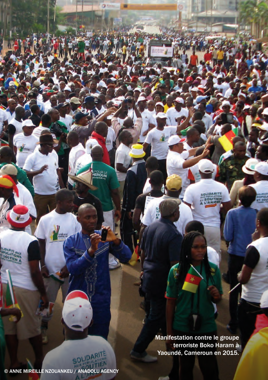
Manifestation contre le groupe terroriste Boko Haram à Yaoundé, Cameroun en 2015.