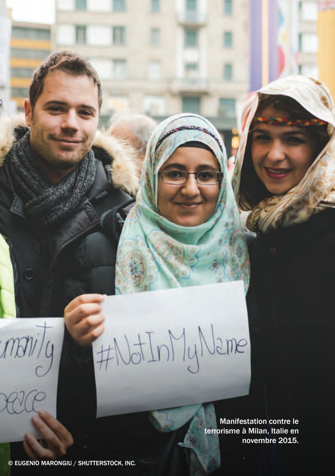
Manifestation contre le terrorisme à Milan, Italie en novembre 2015.