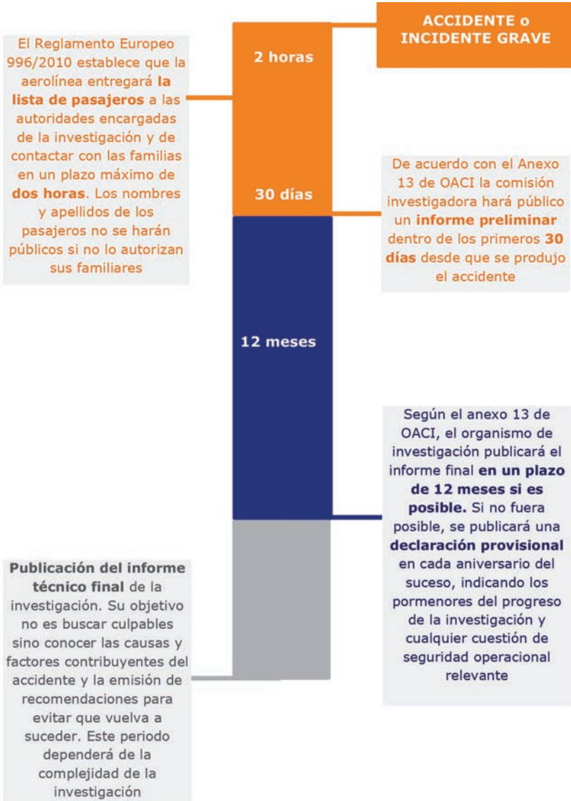
Plazos en la publicación de datos de carácter oficial tras un accidente o incidente aéreo grave según lo recogido por la normativa